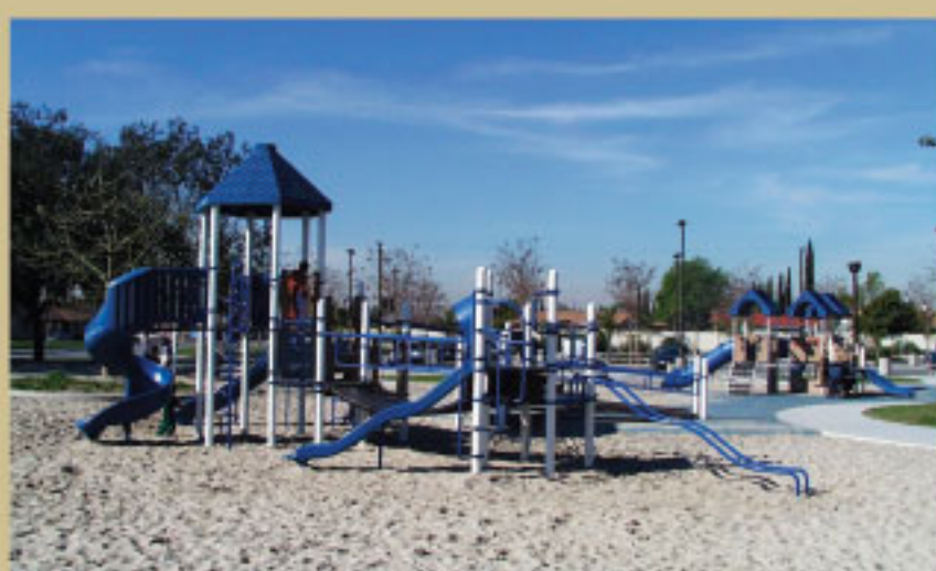
Parque Madison, 2007

Parque Madison: 1528 S. Standard Av. Santa Ana, CA 92707