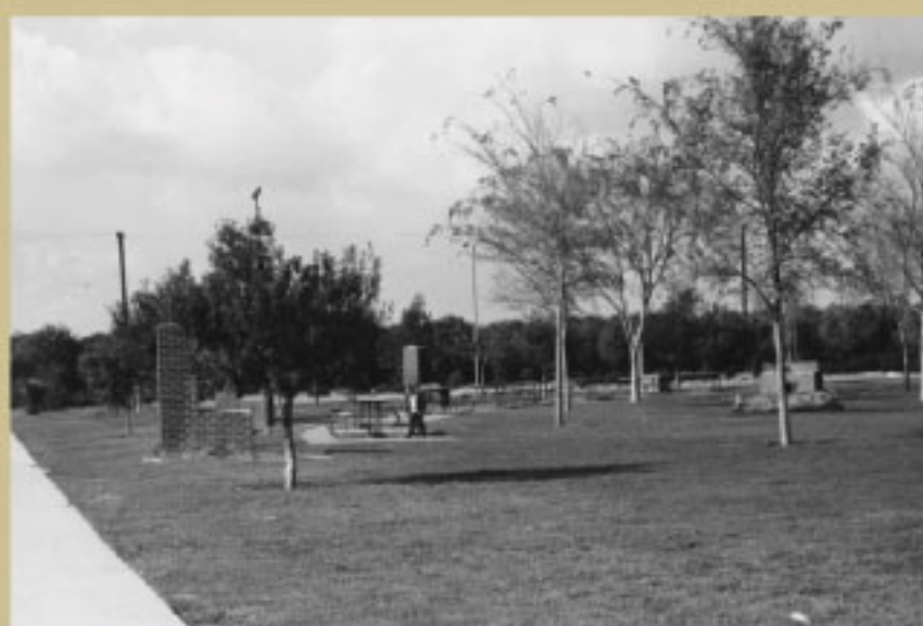
Parque Madison, 1966

El Parque Madison es un divertido parque con 7 acres, que está muy cerca de la Senda Dorada del Este. Está abierto los 7 días de la semana para el uso y disfrute del público en general.