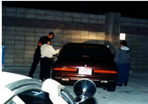
Evite dejar objetos de valor a simple vista